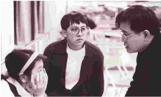
果陀劇場草創時期。