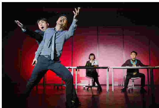
五斗米靠腰二部曲《老闆不願透露的事》劇照。

而果陀劇場在做音樂劇也是這樣的。在華語流行音樂界已經有良好口碑的優異創作者，如：鮑比達、陳國華等編劇、音樂創作人才；有很好的流行音樂歌手，如：江美琪、楊奇煜、郭靜、蔡旻佑、蔡琴等，讓他們都能投身到中文音樂劇的表演裡，藉由他們好的知名度與才能，吸引更多的觀眾來欣賞音樂劇。這是「明星效益」，也是臺灣中文音樂劇很重要的優勢。