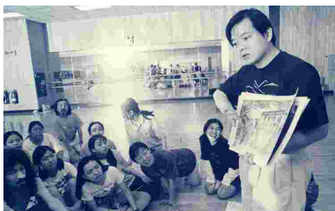
果陀劇場草創時期排練。

潮流，民眾來看戲、聽歌、又有人跳舞，音樂劇雅俗共賞的特質，現在無論在美國紐約、英國倫敦西區，還是最近發展很好的韓國、日本，音樂劇在世界市場上還是大潮流。同時，中文音樂劇不僅僅在臺灣，只要有華人的地方就有機會，如：新加坡、